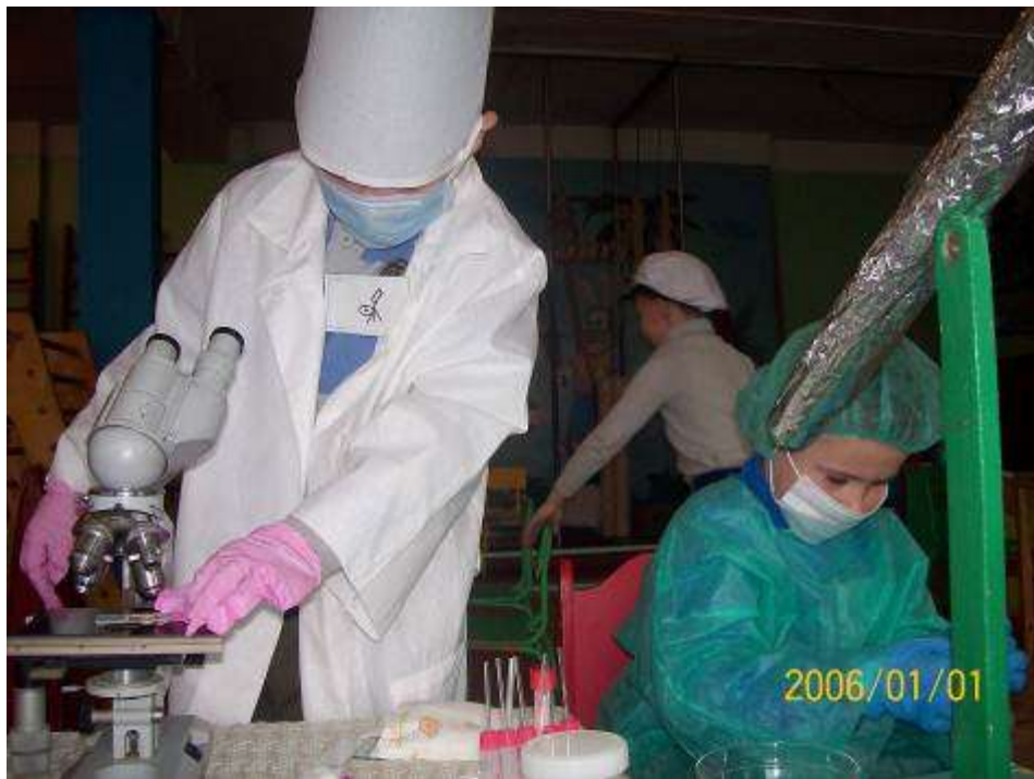
Ученые готовили и проверяли семена цветов к полету на Луну