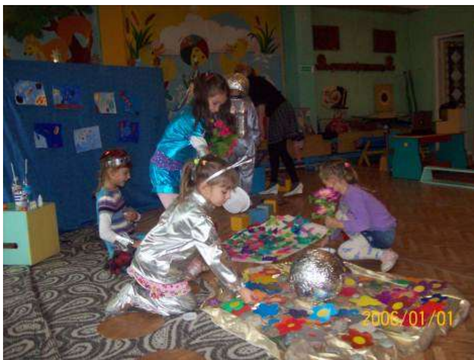
Космонавты и ученые Земли помогли «Лунатикам» украсить их дом цветами.